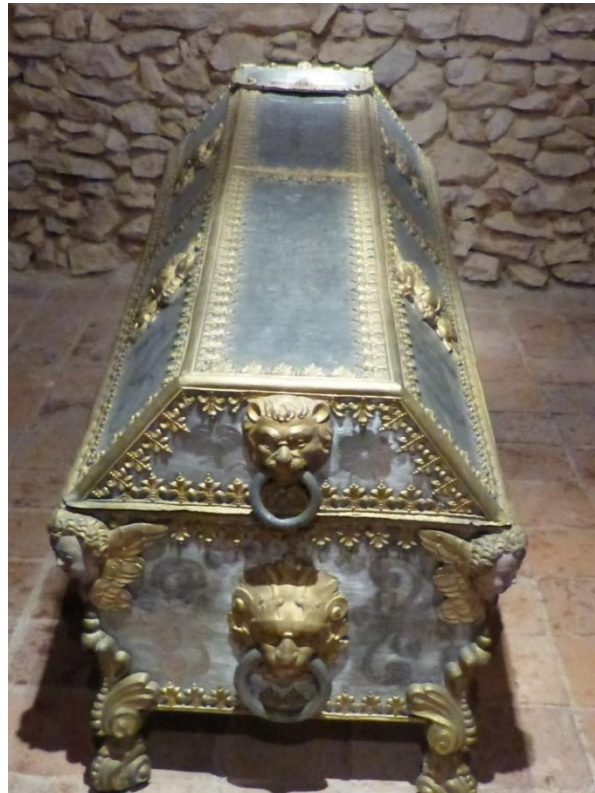
SARKOFAG SIGISMUNDA ERDÖDYJA (+ 1639.)