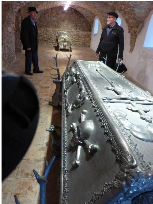
SARKOFAG EMERIKA ERDÖDYJA (+ 1690.)