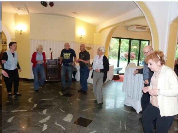
Tekst Zvonimir Kaić & i Dragutin Kremzir